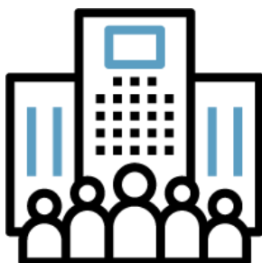
Répartition des 78 Assemblées selon leur typologie

GO CAPITAL n'a pas fait appel à des Conseillers en vote.